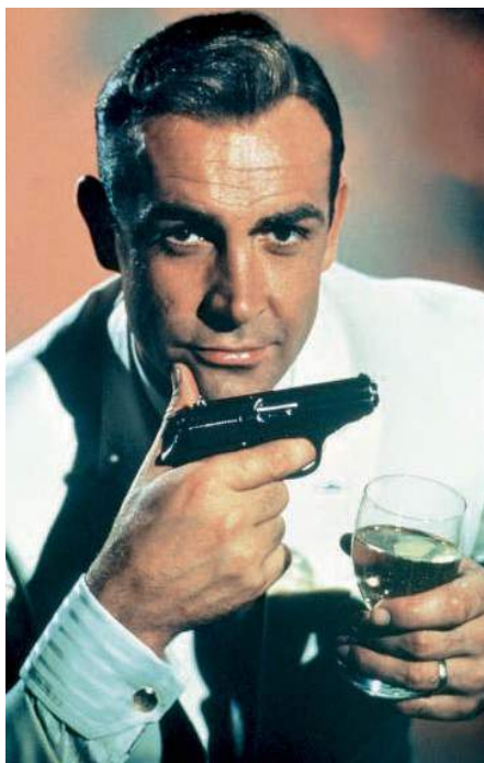
Si l'on additionne tous les verres qu'il sirote en 24 films, Bond a un sérieux problème avec l'alcool !

Conclusion sans appel : Bond a un sérieux problème avec la bibine. Il devrait chercher de l'aide et s'inscrire dans un groupe de désintoxication. Pire encore : Bond n'y connaît